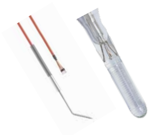
Thermoelemente / Widerstandsthermometer